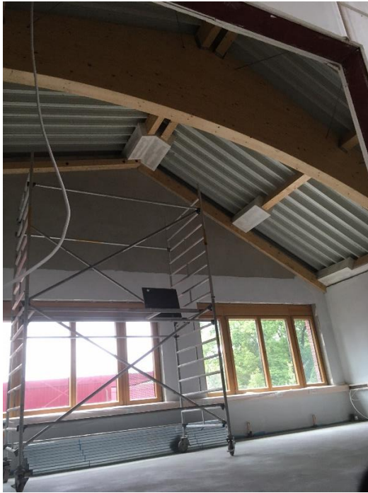
Klassenraum OG vor Montage Holzdecke