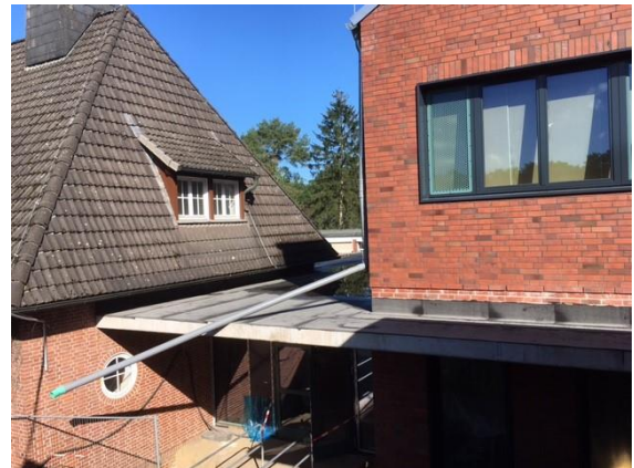
Übergang Neubau zum Altbau