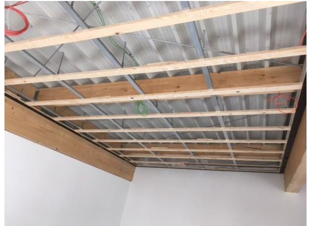
Klassenraum OG UK für Holzdecke