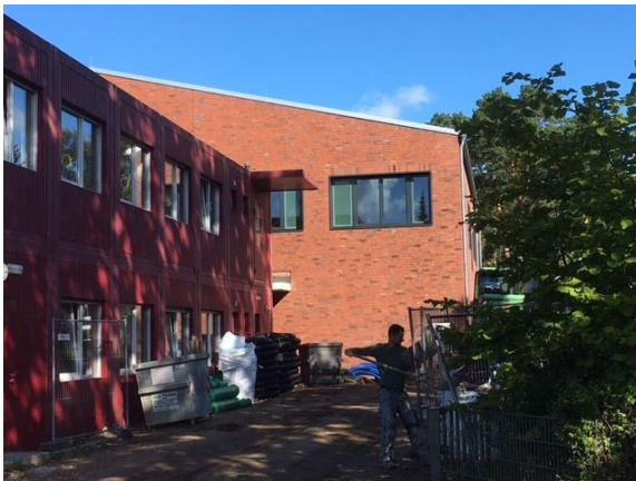
Ansicht 1.BA von der Kampmoorstraße

Von den haustechnischen Gewerken werden die Hauptstränge im gesamten Gebäude verlegt.