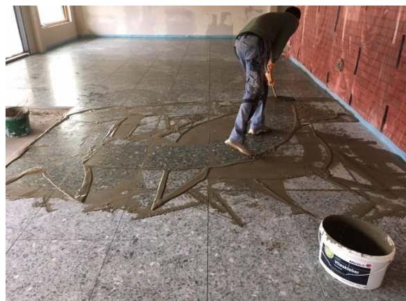
Werksteinarbeiten Schulstraße EG